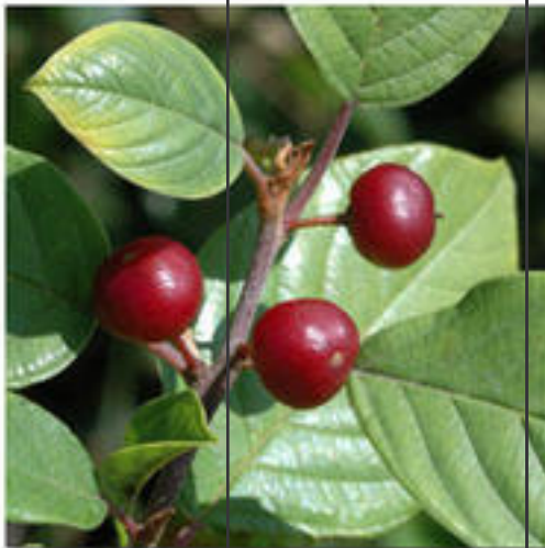
Fruit de Bourdaine