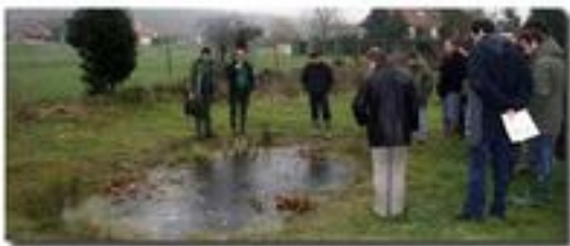
Une mare restaurée dans le Parc des Caps et marais d'Opale

Les Parcs interviennent surtout sur des mares choisies pour leur intérêt écologique et en fonction de la motivation des propriétaires à s'impliquer. Une convention est signée avec le propriétaire pour une durée allant jusqu'au renouvellement de la charte du Parc.