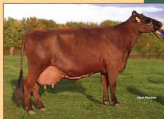
OVORITE mère de VINCI