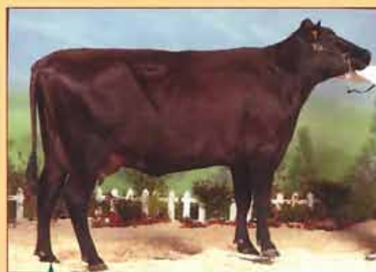
RUNIONE mère de CHOCOLAT