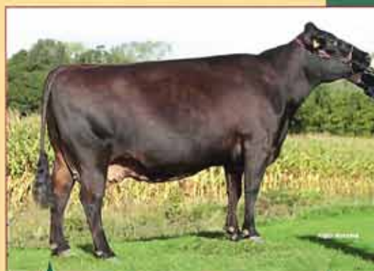
URONNE mère de DOUDOU