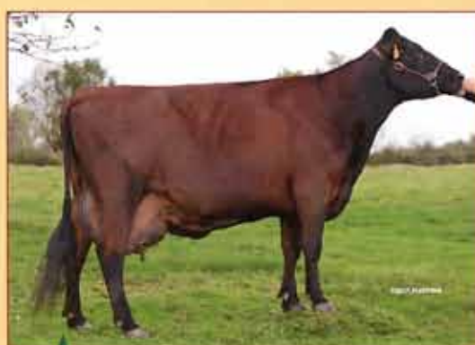
SARDINE mère de DRAGON