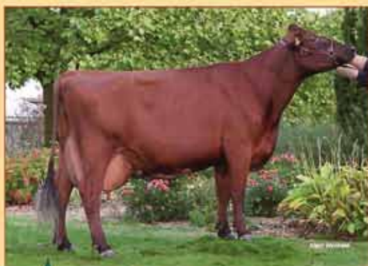
TOSCANE mère de DOCILE