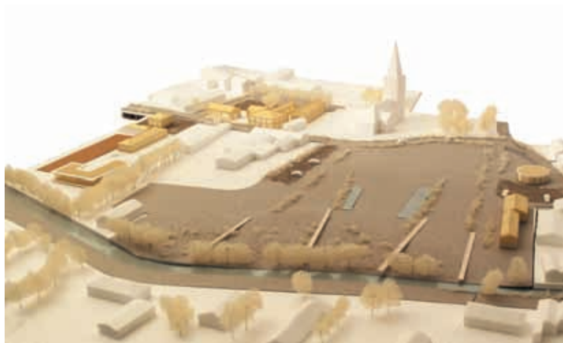
Maquette de la place centrale de Ruminghem

Ainsi, le projet de revitalisation de la place comprend la construction de nouvelles classes pour l'école, le redéploiement de la mairie et l'ouverture d'une garderie. Il prévoit aussi la réalisation d'un filtre à roseaux, d'une zone tampon pour la rivière, d'une esplanade, de stationnements, d'un abris bus et de quelques logements locatifs situés au-dessus des futurs lo-