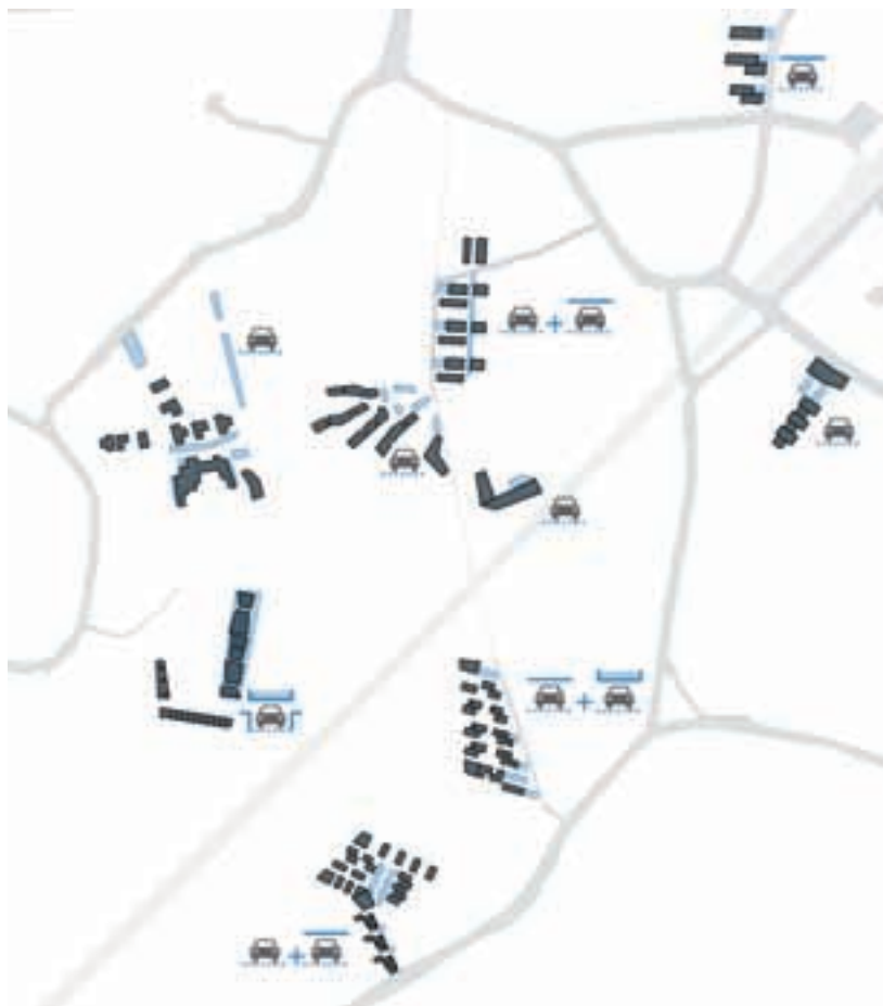
Gestion du stationnement

Toutefois, le stationnement n'est pas au centre de l'espace public.