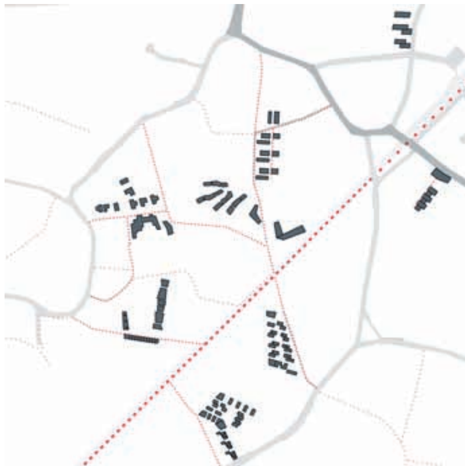
Les traversées piétonnes